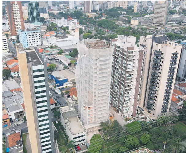
MORADIA. Com 23 prédios a serem entregues neste ano, Santo André lidera ranking regional de verticalização